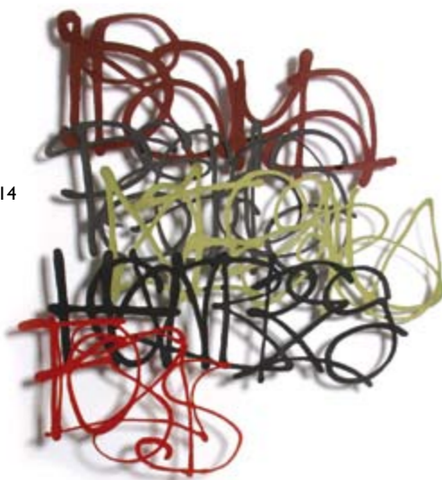
'Graffiti' (2008), gekleurd papierpulp, 100 x 90 cm.

Van het werk van Miriam Londoño is een boekje verschenen, dat u kunt bestellen. Er zijn twee (Engelstalige) versies: één met een handmade paper sample er in, en één zonder. De eerste versie kost € 30,-, de tweede € 15,-. U kunt dit boekje bestellen door een mailtje te sturen naar: miriamlondono31@yahoo.es .