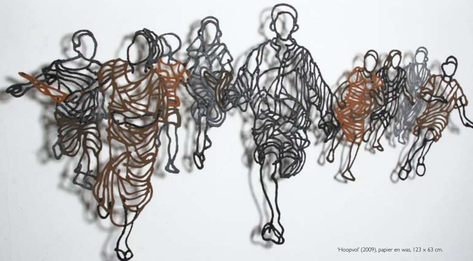
'Hoopvol' (2009), papier en was, 123 x 63 cm.